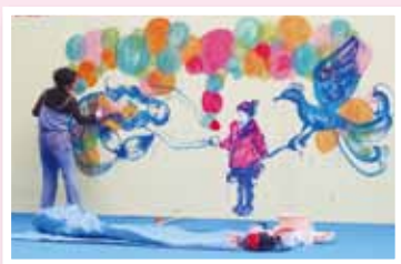
エコフェスタ 2012で行った ライブペインティングの様子