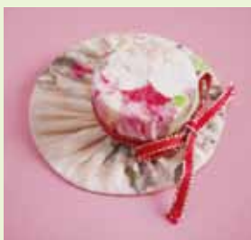
「ペットボトルキャップで帽子のブローチ」

西部3Rステーションでは毎回好評のフリーマーケット(20区画)や、3R実践講座講師による「ペットボトルキャップで帽子のブローチ」講座を実施。さらに今回は福岡市環境局による古着の回収も行われます。洗濯済みであれば破れていても引取ってもらえます(下着・防寒着・皮革製品等は引取りできません)。この機会に着なくなった衣類をぜひ、会場にお持ちください。