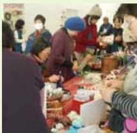
ワークショップ(昨年の様子)

当日、さまざまなエコ体験をしてスタンプを集める「スタンプラリー」に参加した方には、先着で景品もプレゼント。この春一番のエコ体験スポットに、みんなで遊びに来ませんか。