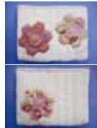
※1作目はアップリケのボーチ(写真は表と裏)

日時/平成29年4月11日(火)~7月11日(火) 原則火曜日 13:00~16:00 定員/12名(抽選) 参加費/1,500円 応募締切/3月25日(土) 必着 持ってくるもの/本体用の布35cm×50cm、はぎれ2種類以上、縫い針(四ノ二)、手縫い糸(60番手)、しつけ針、しつけ糸、布用はさみ。