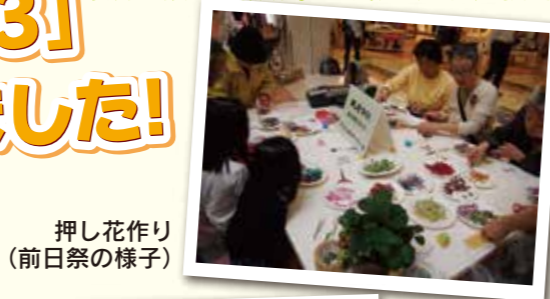
押し花作り (前日祭の様子)