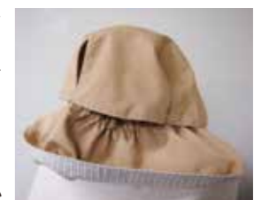
古布で作った五角形帽子

講師養成講座で古布を利用した作品を作ったり見たりしてきました。すばらしいオリジナル作品が出来あがるのを見ると講座を受けて良かったと感謝しています。これから一人でも多くの人に不用品を利用した物作りのお手伝いをさせていただきたいと心から願っています。タンスに入ったままで使い道がない着物や洋服が息を吹き返し、すてきな手作り作品になるのを多くの人と楽しみたいです。