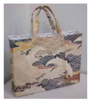
着物を使ったトートバッグ

慌ただしかった仕事生活が布に触れることで落ち着き、新しい仲間との出会いや、いろいろな作品へのトライで裁縫への意欲も増しました。好みは実用的なバストです。 今後も和服の良さを生かした作品作りに励みたいと思っています。