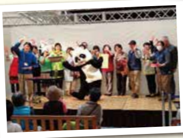
バンドくんの エコな一日