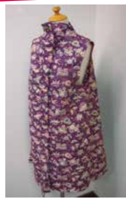
着物から変わり袴のベスト

得意なことは針と糸での布遊び。暮らしの中で楽しみながら服や小物を作ることです。これからは、リメイクして作った物を大切に、物を生み出す工夫をし、思い出なども一緒に折込んで環境に優しい物作りを心がけたいです。