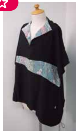
着物を使ったチュニック

タンスに眠っている祖母や母の着物・・・そのまま着物として着るのが一番ですが洋服にしリメイクするのも選択肢のひとつかと思ひ、着物のリメイクを始めました。 思い出の着物に新たな命を吹き込み、日々の生活で使い続けていきたいものです。