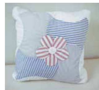
カッターシャツを使ったクッション

家庭に残っている主人のカッターシャツを利用して、簡単なクッションに変身させてみました。 今後も趣味でやってきたパッチワークとリフォームを融合させた作品を提案したいと思います。