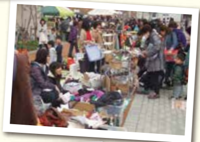
フリー マーケット