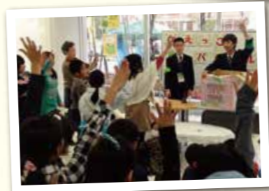
かえっこ バザール