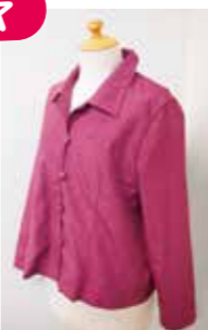
袖で作ったジャケット

パッチワークを始めて30年近くになります。3、4年前から着物リフォームにも興味を持つようになりました。とにかく物作りが好きで、何にでも興味を持って作っています。 また、楽しんで作る。楽しんで作ってもらいたいという気持ちを持ち、自分自身が持たたいもの、着たいものを教えていきたいと思ひます。そして、自分自身の勉強も忘れず新しいことにも挑戦していきたいと思っています。