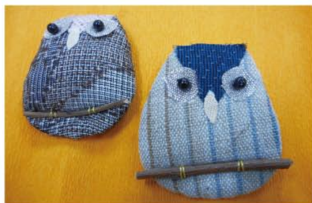
18日 古布を再利用したフクロウのブローチ

18日（土）は古布を再利用したかわいい「フクロウのブローチ」作り。19日（日）はペットボトルキャップを利用したおしゃれな「帽子のマグネット」作りが体験できます。是非、ご参加ください。