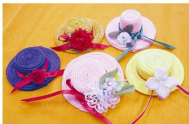
19日 ペットボトルキャップを利用したハットのマグネット作り