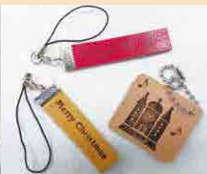
体験できる作品の一部