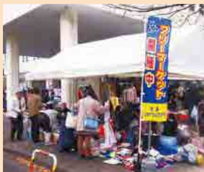
フリーマーケットの様子