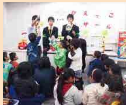
かえっこバザールの様子