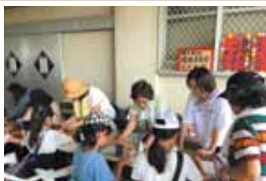
子どもたちに人気の「横手祭」のリサイクル体験のワークショップと環境クイズコーナー

A. いっしょに考え、行動してくれる仲間がいること、勉強したことを生活の中に取り入れ、実践できることがこの活動の大きな魅力です。ごみの分別やマイバッグにしても意識が変われば行動が変わる、行動が変われば自然と次の世代にもつながり、きっと環境も変わっていくはず。今年の夏の猛暑や異常気象など、地球環境が目に見えて変わってきていますよね。今後は地球温暖化のことや自然エネルギーのこと、食品ロスの問題など、さらに幅を広げて勉強会などをやっていきたいと思えます。