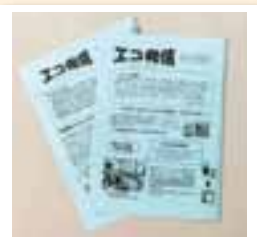
年一回「エコ発信」を発行。校区全戸に配布している。

A. 横手公民館が開館した平成10年にスタートしました。委員会発足に熱心に関わられた先輩方のパワフルな活動が、私たちの大きな原動力となっています。環境に関する行動って、ごみの問題や食品ロスなど日々の生活に関わっていることが大半で、そこに根付いていかないといけないと思うんです。そういう意味で発足時のメンバーの中に女性の視点があつたことも、大きな意味があつたと思います。そんな先輩方が築いてくれた礎をしっかりと次世代へつなげていきたいですね。現在、メンバーは役員と各町内の委員合わせて21名。よりよい委員会活動にしようと規約を定め、定例会やさまざまな勉強会を行っています。横手校区の皆さんはとにかく“横手愛”が強く、子どもたちはもちろん高齢者も皆さん元気いっぱい。学校も地域との交流をととても大切にしている、みんなで地域を盛り上げよう、いっしょに子どもたちを育てていこうという気持ちが強く、その思いが私たちの活動を後押ししてくれています。