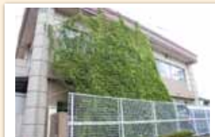
横手公民館の緑のカーテン