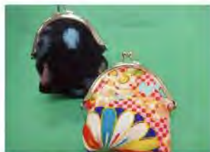
がまぐちコインケース