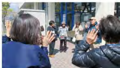
耳を澄まし自然の音や声を 聞きました