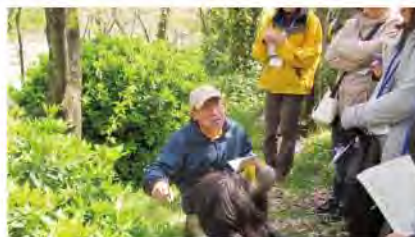
草植物の中にプラスチックのトカゲ など、人工物を隠し、発見するカモフラージュ“ゲーム”