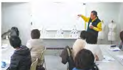
生物多様性による自然の バランスについてのお話の様子