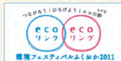
今年度のロゴマーク