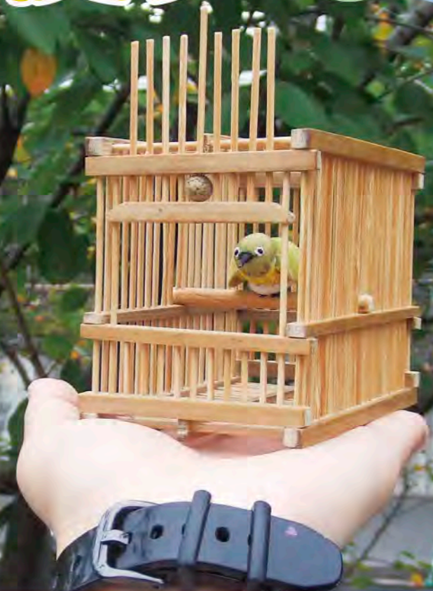
竹を使った鳥かごと貝殻で作ったメジロ ふくおか環境倶楽部メンバー作 サイズ(高さ8cm 幅6.5cm 奥行10.5cm)

福岡市西部3Rステーションは、環境学習や環境活動の場、福岡市のごみ減量や3Rに関する情報発信の場として、「循環のまち・ふくおか」の一翼を担う施設です。今、地球温暖化やごみ問題など様々な環境問題が起きています。「環境にやさしい循環型社会」を作るため、私たち一人ひとりが自分たちの生活の中で、できることから取り組みを進めていくことが大切です。みなさんも、自分にできることを見つけてみませんか？