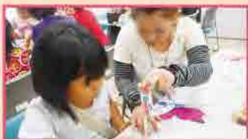
かわいいアクセサリーが出来るといいね