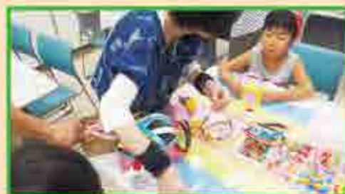
どんなカチューシャが出来るかな？