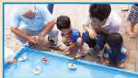
ぼんぼん船が遊泳しています！