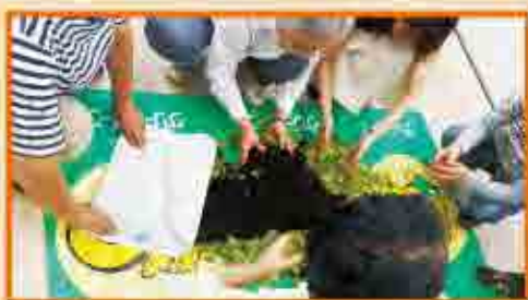
生ごみを利用した土づくりの様子