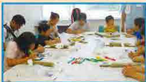
ぼんぼん船にお絵かき中～