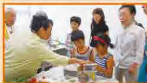
みなさん真剣です！