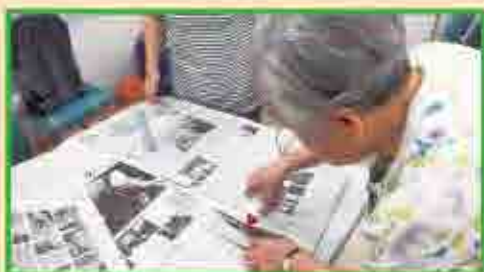
新聞紙のエコバック作成中です。