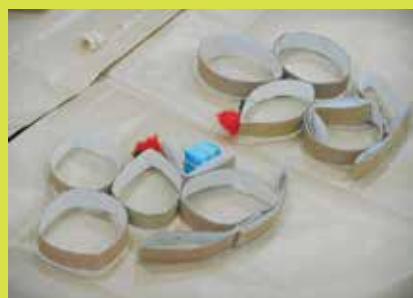
ネズミ型のクラフト作品