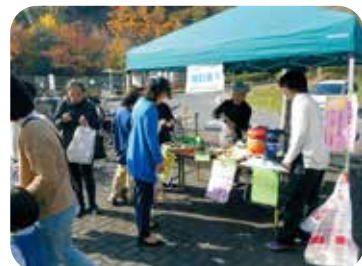
ワークショップ祭り