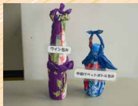
左：ワイン包み 右：手提げペットボトル