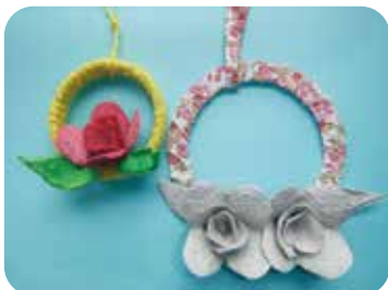
体験講座「卵パックでバラのリース作り」

3Rステーションでは、市民のみなさんに環境問題に関心を持っていただくために、ごみ減量や資源の有効利用に関する情報や体験の場を提供しています。不用になったものを利用したもの作り体験や着なくなった衣類をリフォームする講座等のほか親子で楽しめるイベントを開催しています。また、不用品（衣類や図書）の引き取りや提供も行っています。是非、一度3Rステーションに来ていただき、ごみ減量や資源の有効利用について考えてみませんか。