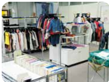
衣類・図書の提供コーナー