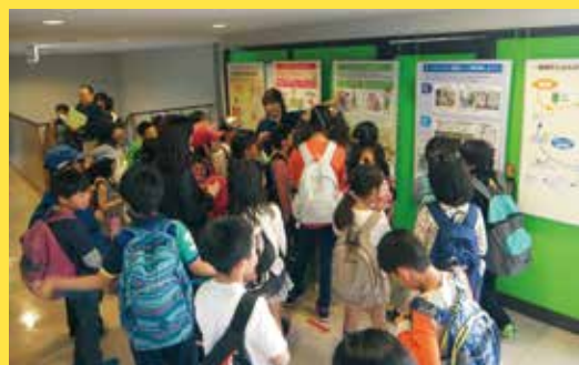
福岡市立千早小学校のみなさん

福岡市のごみの量や処理にかかる費用など、ごみの現状を説明すると、1日に出されるごみの量にはとても驚いた様子でした。また、廃油を使った石けんや、不用なものを利用した工作作品を見て「スゴイ!!!」と感動していました。生徒のみなさんにはこの見学を通して、3Rについて知ってもらい、ごみの減量に取り組むきっかけになってくれたら良いと思います。