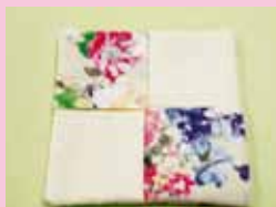
端切れてコースター