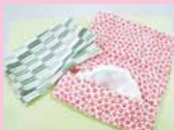
手作りティッシュケース