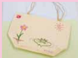
封筒からお給かきバック