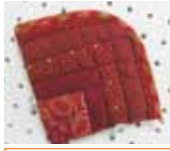
1回目作品 ログキャビンのポーチ

応募締切/7月22日(金) 必着 持ってくるもの/30cm×30cmの布3~7種類、又は残り布で4cm幅×30cmのものを何種類かでもよい。手縫い糸(あれば60番手)、縫い針(あれば四の二)、まち針、布用はさみ、裁縫道具一式