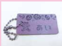
革の端切れてネームタグ