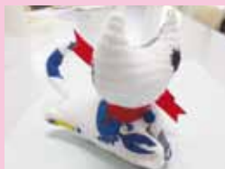
洗濯ばさみで「だっこちゃん」