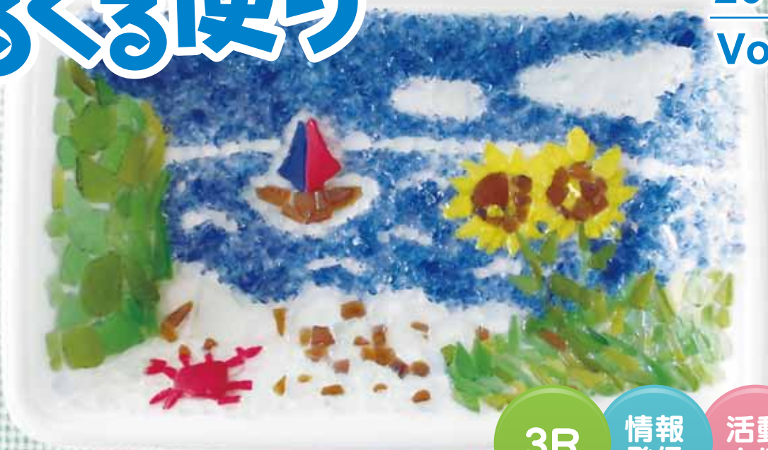
食品トレイに描いた廃ガラスアート