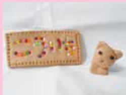
おがくず粘土「もくねんせん」