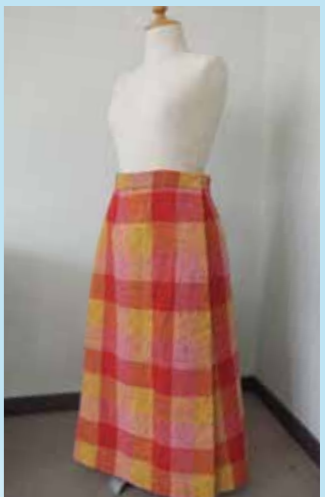
コートからスカート