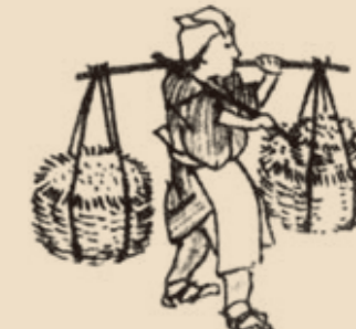
灰の回収業者(「守貞諷稿」より)