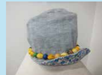
ベストから帽子とネクタイのネックレス