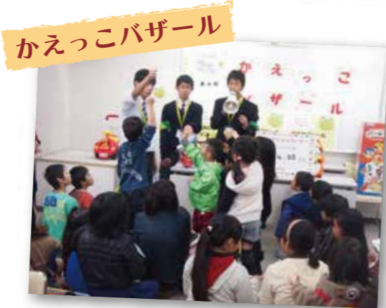
かえっこパズール