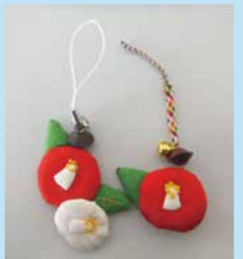
古布でストラップ(そろばん玉利用)