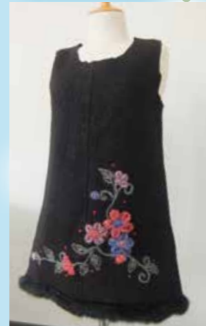
スカートからチュニック