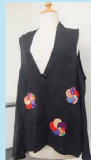
黒の着物でベスト