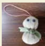
雪だるまストラップ

毎月変わるミニワークショップ、1月は「エフロク」のみなさんによる「雪だるまストラップ作り」など 日時/平成25年1月6日(日)10:00~15:00 場所/2階 参加費/100円~(事前申込み不要)