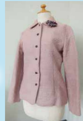
ウールの着物からジャケット