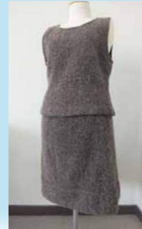
コートからベストとスカート