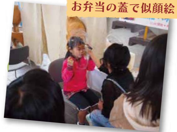
お弁当の蓋で似顔絵