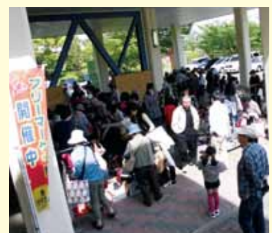
3Rステーション主催の祝日フリーマーケット

※西部3Rステーションでは10月10日（祝・月/10:00～14:00）と11月23日（祝・水/10:00～15:00）、祝日フリーマーケットを開催します。11月23日開催分はただいま出店者を募集中です。詳細はP4の講座・イベント情報でご確認ください。