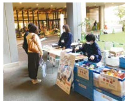
出張フードドライブの様子

皆様にご提供いただいた食品は『特定非営利活動法人フードバンク福岡』を通じ、必要とする方々へお届けしています。たくさんのご支援ありがとうございました。引き続きフードドライブ活動へのご協力をよろしくお願いいたします。