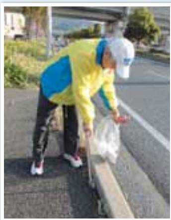
歩道わきには捨てられたタバコの吸い殻がいっぱい。

A. 月に20日前後というところでしょうか。雨の日や会議等の予定のある日以外はほぼ毎日、コースを変えながらごみを拾って歩いています。歩数にすると15,000歩程度。食品の空き容器やお菓子の袋、空き缶やペットボトル、たばこの吸い殻、マスクなど、一周すると毎回ポリ袋がいっぱいになります。道路わきには明らかに車から投げ捨てられたと思われるごみもあるし、家庭ごみを持ってきて置いていく人や通りがかりに「これもお願い」と手渡されることも。そういうマナーの悪い人に出会うとがっかりすることもあります。が、「いつもありがとうございます」と声をかけてくださる方もいて、そういう時は本当にうれしいですね。