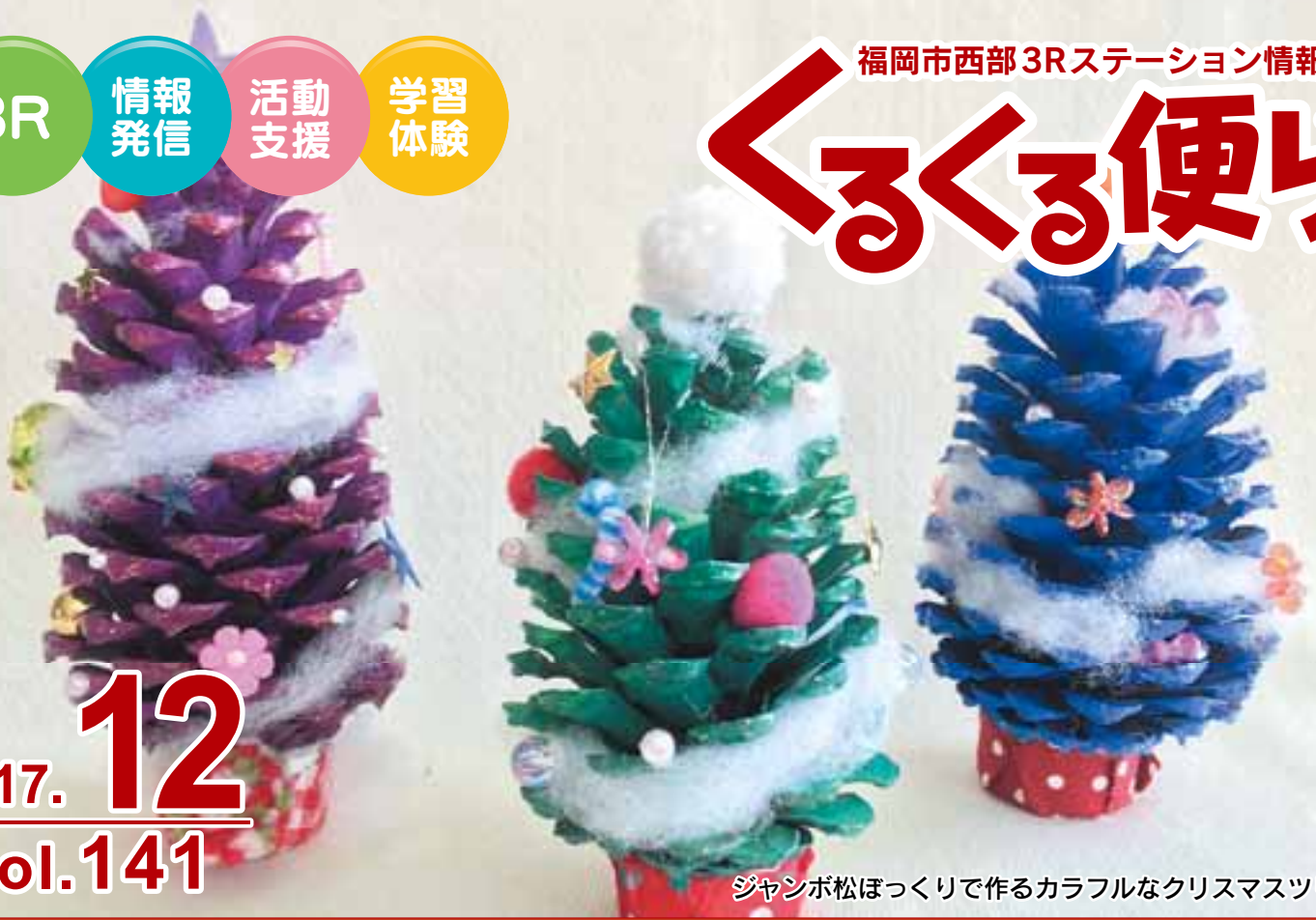
ジャンボ松ぼっくりで作るカラフルなクリスマスツリー