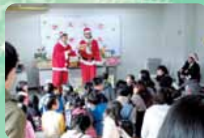
かえっこバザール（昨年の様子）

当日は「おもちゃのかえっこバザール」も同時開催。遊ばなくなったおもちゃを「かえるポイント」に換えて、欲しいおもちゃと交換しませんか。おもちゃの持ち込みは一人10点までOK（ただし壊れたおもちゃやビデオ・CD・DVDソフトは不可）。バザールの締めくくりにはポイントの高いおもちゃを集めたオークションも行われます。クリスマスエコものの作りの各種ワークショップに参加して集めた「かえるポイント」でも、かえっこバザールに参加できますよ！