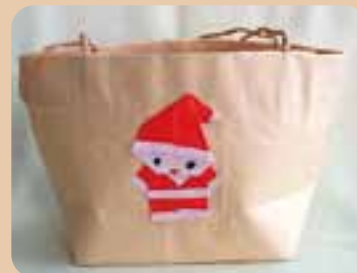
「封筒でサンタのバッグ作り」