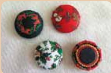
「クリスマス柄のマグネット」