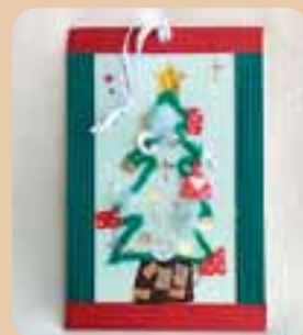
「クリスマスの壁飾り」