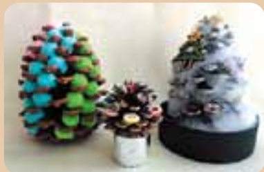
「松ぼっくりのクリスマスツリー」