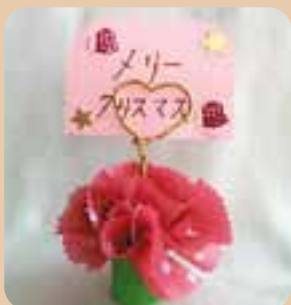
「クリスマスカードスタンド」