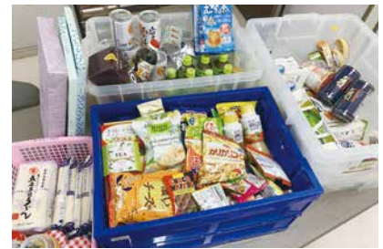
2月に西部3Rステーションに届けられた食品の一部

そこで西部3Rステーションでは4月1日から「フードドライブ」を本格的にスタートします!ご提供いただく食品は1点から大歓迎、少量でも構いません!これまで寄付する手段がわからずに捨てていた食品を持ち寄り、支援の輪を広げましょう!