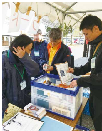
提供されたたくさんの食品がイベント会場での「フードドライブ」の様子

フードバンクに食品を受け取りに来る人は多種多様な食品を必要としています。ご家庭に不用品がある方は、ぜひ「フードドライブ」にご協力ください!