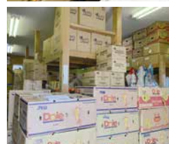
提供されたたくさんの食品が並ぶ倉庫(フードバンク福岡)