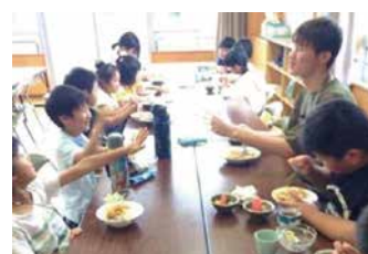
子どもたちの笑顔を支える食事(子ども食堂にて)

「貧困」と「食品ロス」の問題は、2019年9月に国連サミットで採択された「SDGs(持続可能な開発目標)」にも掲げられている世界規模の課題です。フードバンクの活動は貧困世帯の子どもたちへの食料支援を通じて、食品ロスと貧困問題の対策にも貢献しています。