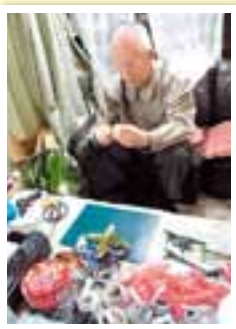
自宅の間が作業場に