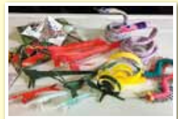
シュロの葉の昆虫を始め、廃品で作った生きものたち

A. まずは自分自身が楽しむこと。昔から廃物利用が大好きで、廃棄物を見ると捨てるのはもったいない、何か作れないかとあれこれ考えるのが楽しくて仕方ありません。最近の子どもたちは自分で何かを作って遊ぶ機会は少ないですが、発想の豊かさや遊ぶことが大好きという気持ちは昔と同じ。私のほうが子どもたちから教えられることも多いです。最近は高齢者向けの講座依頼も増えましたが、皆さん子どもの頃を思い出して、夢中で作り、遊んでくれます。中には講座がきっかけで子や孫とのコミュニケーションが増え、「元気が出た。」「生き甲斐ができた。」と言ってもらえることも。涙が出るほどうれしい瞬間です。