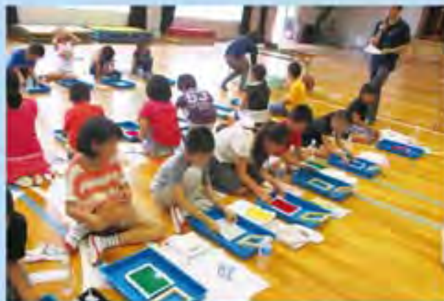
紙すき体験の様子