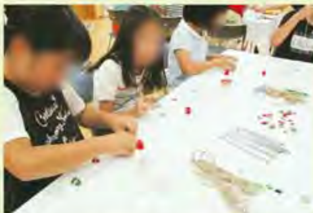
工作中です。みんな真剣!!

まず、材料となっているガラスの適正分別について考えてもらいました。風鈴づくりでは、出来上がった風鈴を見て、「家に持って帰ったらしっかり飾ります。」といった子や「音色が優しくて涼しさを感じます。」「きちんと分別してごみを出します」といった保護者からの声もいただきました。