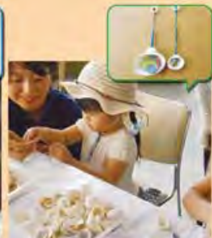
貝殻ネックレス作り