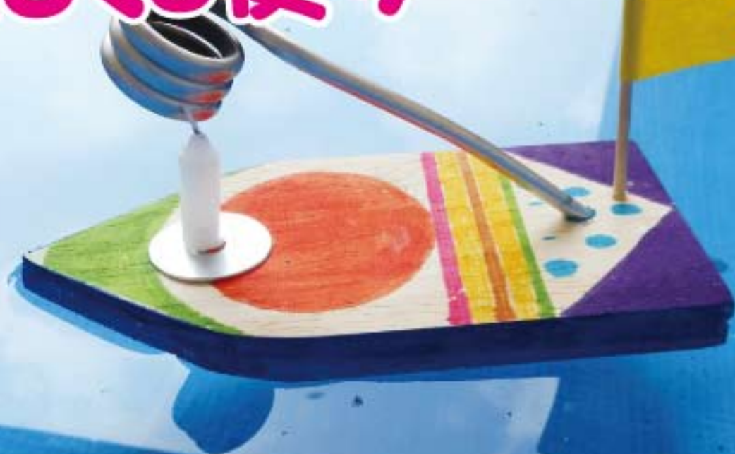
廃木材から作ったほんほん船