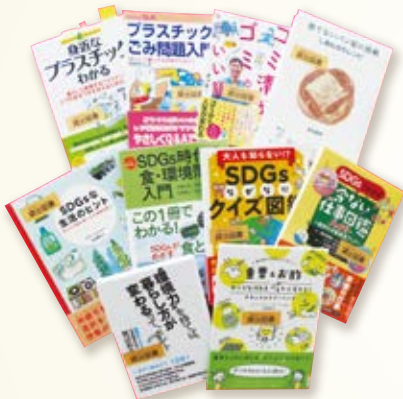
▲海洋プラスチックごみや食品ロスなど環境問題に関する本