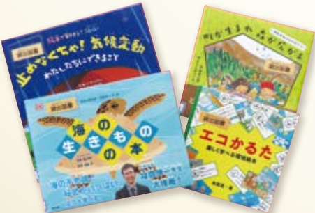
▲子ども向けの環境問題に関する絵本