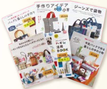
▲端切れや牛乳パックを使った手芸に関する本