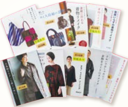
▲着物等、衣類のリメイクに関する本