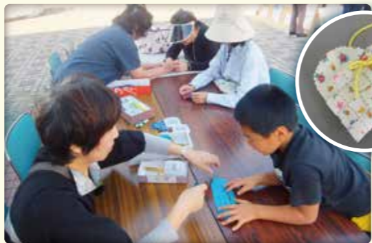
古布でポップリ入れ作り