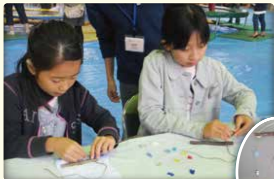
廃ガラスでモビール作り