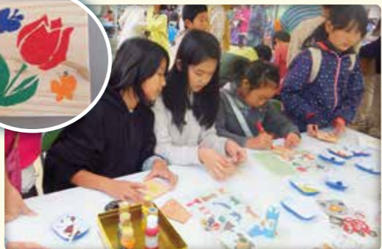
間伐材でコースター作り