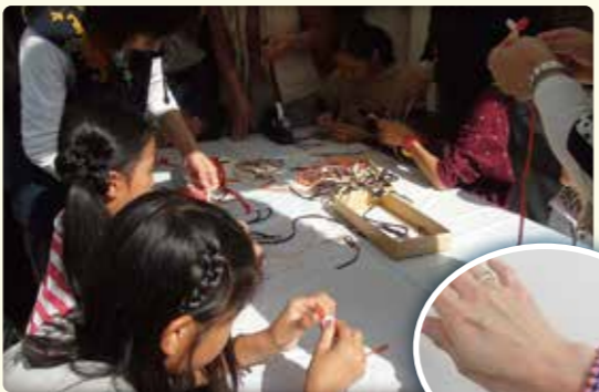
古布でミサンガ作り