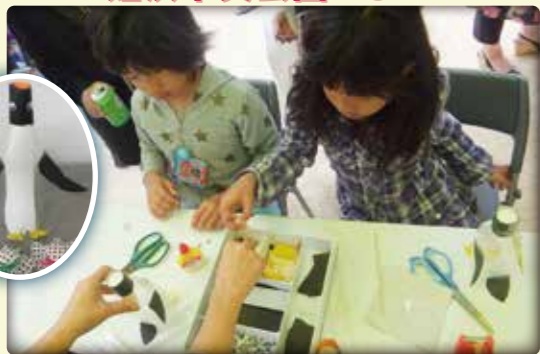
ペットボトル貯金箱作り