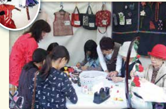
端布でかかしのブローチ作り