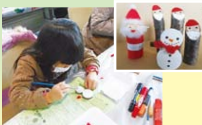
木の枝サンタと雪だるま

最終日の21日(日)には、かえっこバザールを開催しました。エコもの作りやゲームに参加してポイントを貯めたり、家で遊ばなくなったおもちゃを持参してポイント貯めたりしながら、貯めたポイントと欲しいおもちゃを交換してリユースの体験をしました。