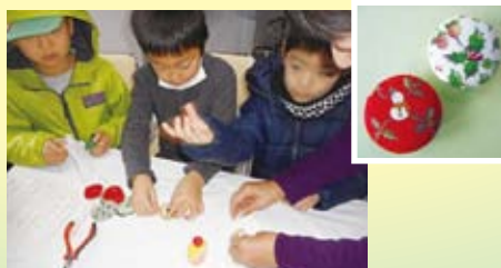
クリスマス柄マグネット