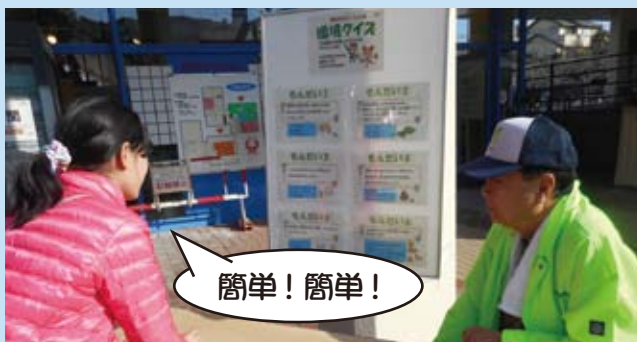
環境クイズの様子（子ども用）

環境クイズやワークショップを体験した参加者からは、「環境問題をもっと真剣に考えようと改めて思いました」といった声や「ごみを減らす方法を考えさせられました。」などの声をいただきました。