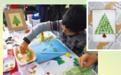
ガラスのクリスマスツリー