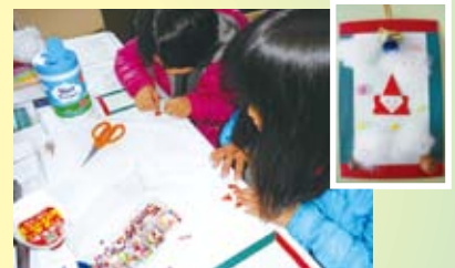
紙のサンタ壁飾り