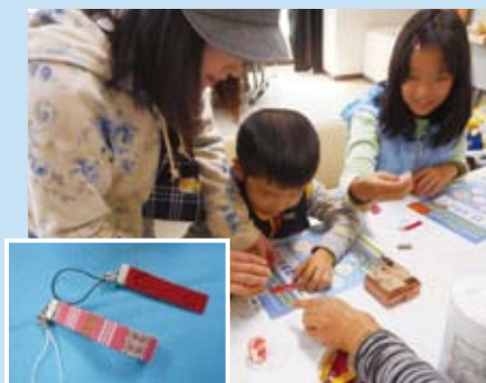
ワークショップの様子①