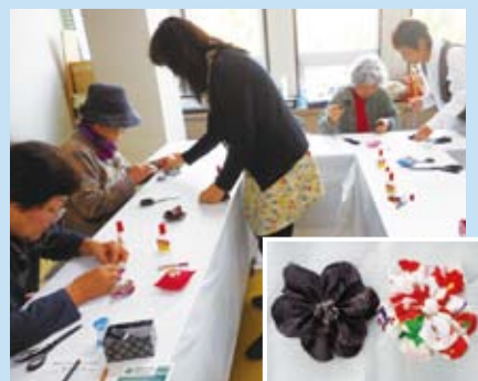
ワークショップの様子③