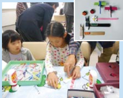
ワークショップの様子②