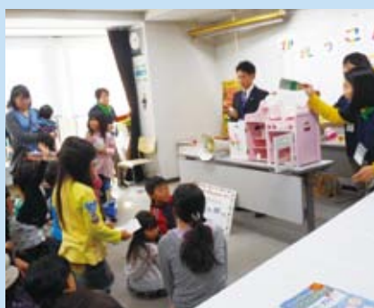
かえっこバザール