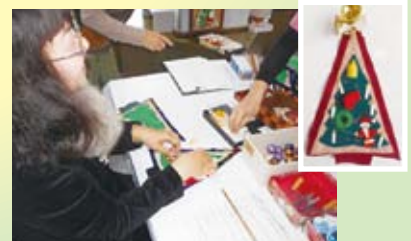
古布クリスマススタペストリー