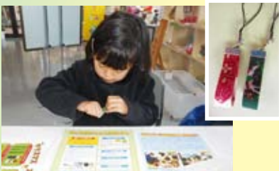
クリスマスカラーのストラップ