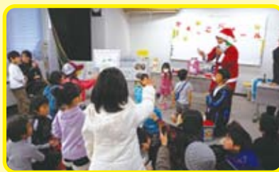
かえっこバザール