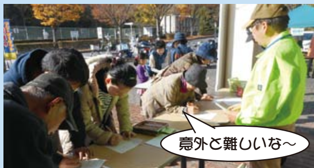
環境クイズの様子（大人用）