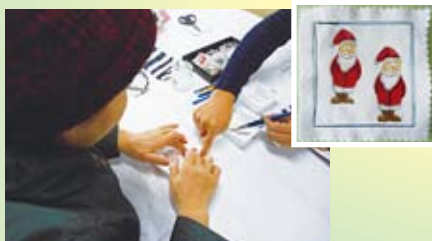
クリスマスプリントコースター