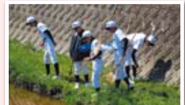
毎月1回、原中学校の野球部の生徒が自主的に川の清掃に参加。

A. 地域の子どもたちにとって身近な油山川が、水遊びもできない川ではあまりにも残念、地域に住む大人たちが何とかしなければという思いが原動力となって、平成18年10月に発足、会員は現在53名です。県や市に要請して河川改修や護岸工事を重ねながら、地域の皆さんと協力し、美化活動を行ってきました。