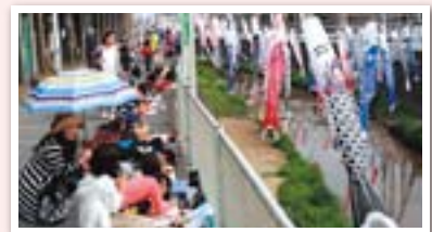
春恒例の鯉のぼり写真会

A. きれいになった川にはコイやカメが棲みつき、サギやカモなどの水鳥も姿を見せるようになりました。休みの日には子どもたちが川遊びを楽しみ、関心を持ってくれる地域の方も増えてきました。将来は“ホタルの飛び交う川”にしたいというのが、私たちの大きな目標です。ただ会員のほとんどが70代以上の高齢者。油山川を通じて、次世代へ環境の大切さを伝えていくためにも、若い方たちにもぜひ活動に参加してもらいたいですね。