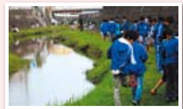
室見川水系一斉清掃

A. 清掃活動は年に9回。会員を中心に、自治協議会、地域住民、学校、企業など、年間延べ600人以上が参加してくれています。特に飯原小学校、原中学校には我々の活動にたいへん理解と協力をいただいております。毎年11月に行われる室見川水系一斉清掃には、小中学生だけでも150人ほどが集まってくれます。子どもたちが参加することで、親世代にも油山川が地域の共有財産だという意識が広がってきたと思います。