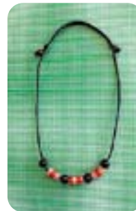
「博多織で作った ビーズのネックレス」