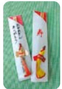
「かわいいはし入れ」