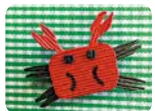
「カニさんのマグネット」