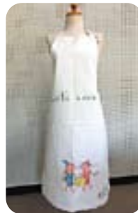
「親子でつくる エコクックエプロン」