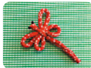
「古布を使ったトンボのブローチ」