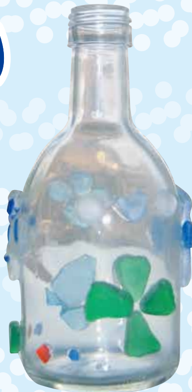
空きびんリメイク